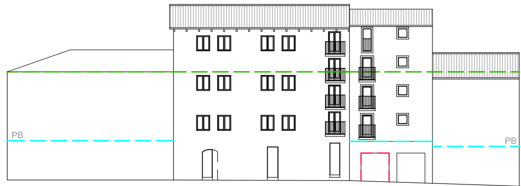
C/DE L'ABAT VELMANYA